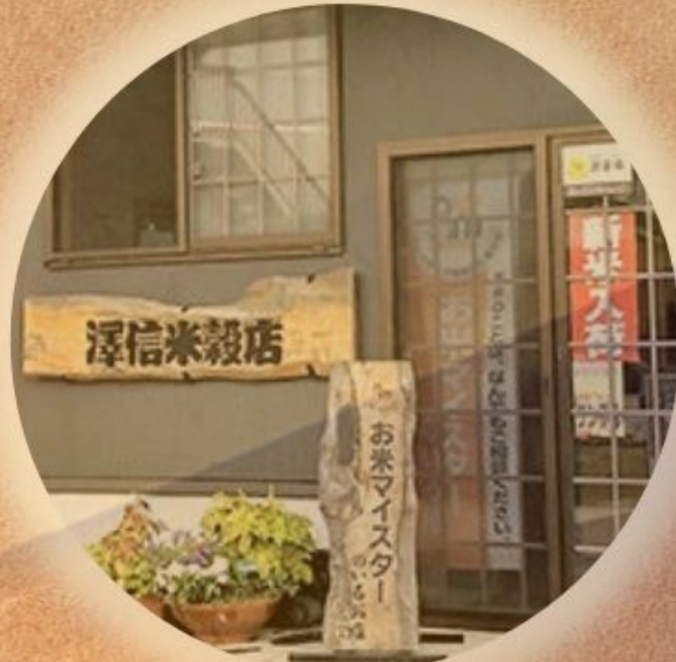
澤信米穀店 五ツ星お米マイスター厳選米