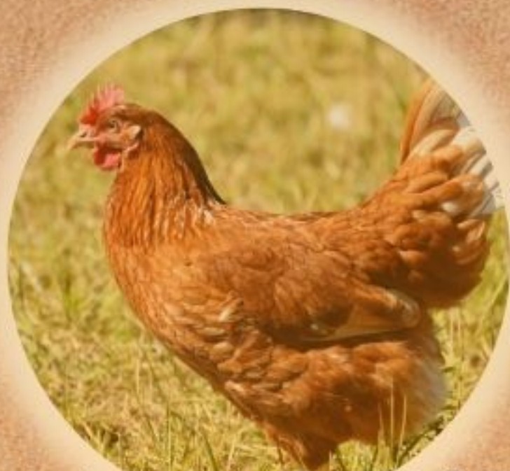
ひたちなか横須賀養鶏場 おれんじ玉子